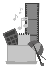
Formation et culture